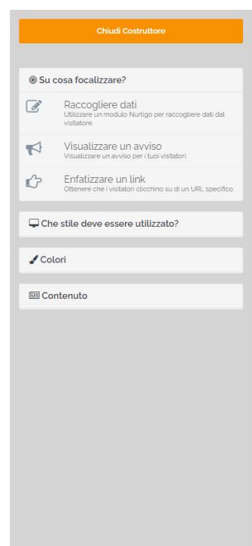
il costruttore dei focus items

Selezionato l'obiettivo del focus item, sarà possibile inserire alcune parametrizzazioni aggiuntive.